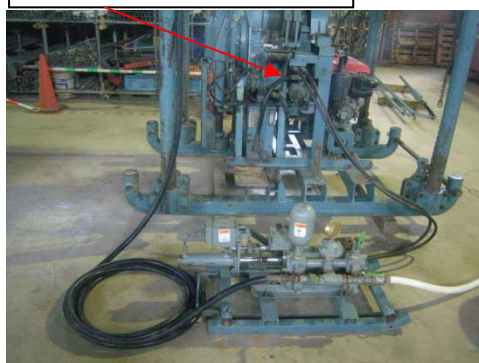
(ユニット接続状況)